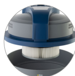
Filtro cartuccia in PTFE (classe M) sempre installato