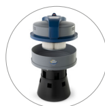
Ultra FilteRing System