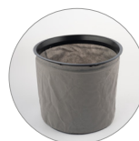
Filtro in TNT (optional)