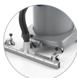
Barra di aspirazione (optional)