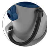
Tubo scarico serbatoio per i liquidi (PD)