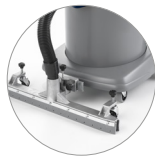
Barra di aspirazione (optional)