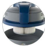
Filtro cartuccia in PTFE (classe M) sempre installato