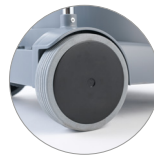
Ruote posteriori grandi