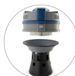
Ultra FilteRing System