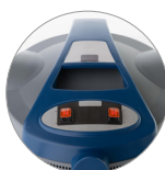
Interruptores 2 motores