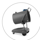
Depósito con sistema basculante