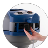
Filtro aire de escape