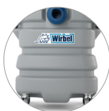
Depósito de plástico resistente a los impactos