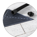
Manguera de drenaje