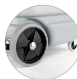
Ruedas delanteras giratorias y ruedas de gran diámetro