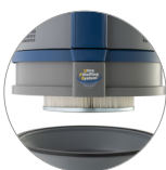
Filtro cartuccia in PTFE (classe M) sempre installato