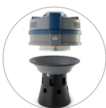
Ultra FilteRing System