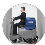
Dimensioni compatte, agile in spazi stretti