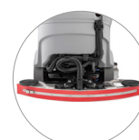
Tergitore compatto con gomme naturali