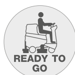
Funzione "Ready to go"