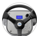
Pannello comandi con display