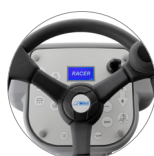
Panel de mandos con pantalla