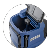
Depósito de recuperación: acceso y limpieza fáciles