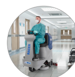
Función en modalidad silenciosa