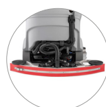
Tergitore compatto con gomme naturali