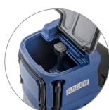
Serbatoio di recupero: facile accesso e pulizia