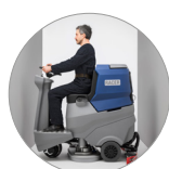
Dimensioni compatte, agile in spazi stretti