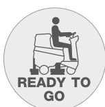
Funzione "Ready to go"