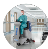
Funzione modalità silenziosa