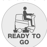
Funzione "Ready to go"