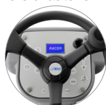
Pannello comandi con display