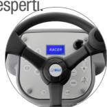
Pannello comandi con display