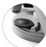
Testata retrattile con paraspruzzi