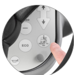
Funzione "Ready to go"