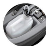
Chemical mixing system