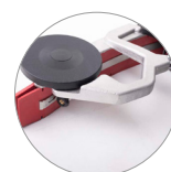
Gruppo tergitore in alluminio