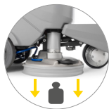
Extra Druck auf den Boden