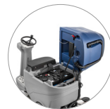
Gute zugänglichkeit aller Komponenten