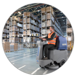
Ergonomie und Komfort