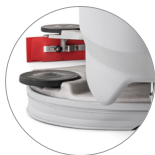
Saugbalken und kopf aus Aluminium