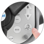
Funktion "Ready to go"