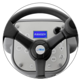
Bedienpult mit Display