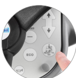
Funzione "Ready to go"