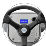
Pannello comandi con display