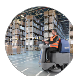
Ergonomia e comfort