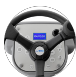
Pannello comandi con display