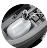
Chemical mixing system