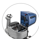
Agile accesso a tutte le componenti