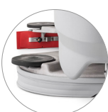
Gruppo testata e tergitore in alluminio