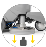
Extra pressione a terra