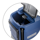
Serbatoio di recupero: facile accesso e pulizia