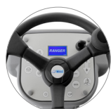
Pannello comandi con display