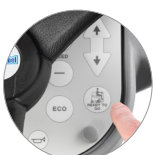
Funzione "Ready to go"