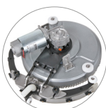
Secador compacto para cubrir así completamente la pista de lavado