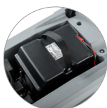
Kit Hybrid (para versión Hybrid)