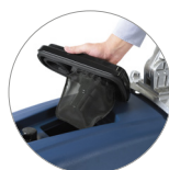
Coperchio removibile + galleggiante + filtro