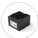
Batteria Lithium (per versione Lithium e Lithium PLUS)