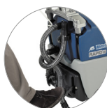
Sollevamento tergitore a pedale