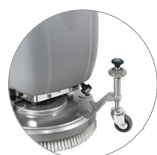
Ruotino esterno, regolazione in altezza