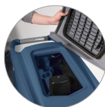
Sammelfilter für große Unreinheiten + Schutzfilter des Saugmotors