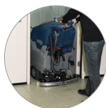
Einstellbarer und kompakter Saugbalken