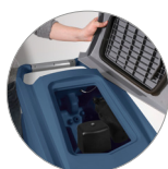
Filtro recogedor de partículas grandes + filtro motor de aspiración