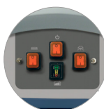
Panel de mandos