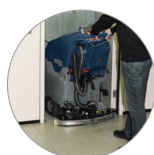
Secador regulable y compacto