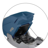
Sistema de depósito abatible