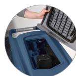
Debris tray + filtro motore aspirazione