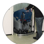
Tergitore regolabile e compatto