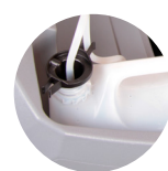
Chemical mixing system