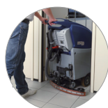
... e compatto