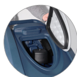
Debris tray + filtro motore aspirazione