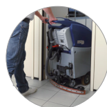
Debris tray + filtro motore aspirazione