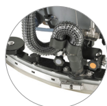
Tergitore regolabile e compatto