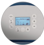
Bedienfeld mit display