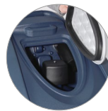
Sammelfilter für große Unreinheiten + Schutzfilter des Saugmotors