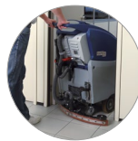
und kompakter Saugbalken