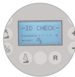
Zugangspasswort, Praktikabilität und Sicherheit