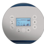
Pannello di controllo con display