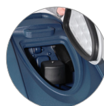
Debris tray + filtro motore aspirazione