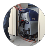
... e compatto