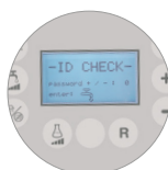
Password per praticità e sicurezza