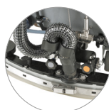
Tergitore regolabile e compatto