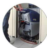
Debris tray + filtro motore aspirazione