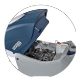
Sistema de depósito abatible