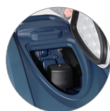
Filtro recogedor de partículas grandes + filtro