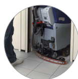
Debris tray + filtro motore aspirazione