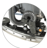
Tergitore regolabile e compatto