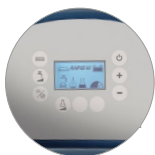
Bedienfeld mit display