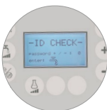
Zugangspasswort, Praktikabilität und Sicherheit