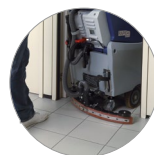
und kompakter Saugbalken