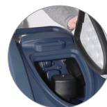
Sammlerfilter für große Unreinheiten + Schutzfilter des Saugmotors