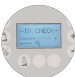
Contraseña de acceso (practicidad y seguridad)