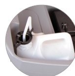
Chemical mixing system