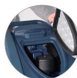
Filtro recogedor de partículas grandes + filtro motor de aspiración