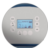
Panel de mandos con pantalla