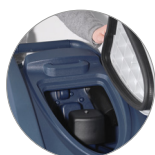
Debris tray + filtro motore aspirazione