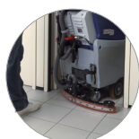
... e compatto