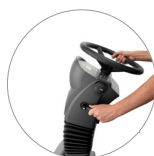
Piantone sterzo regolabile