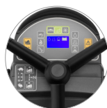
Pannello comandi con display