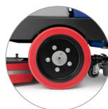
Trazione sulle ruote posteriori (versioni RD)