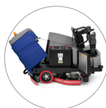
Agile accesso a tutte le componenti