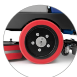
Trazione sulle ruote posteriori (versioni RD)