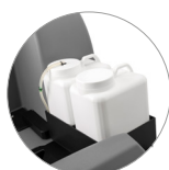
Chemical mixing system