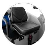
Sedile regolabile ed ergonomico