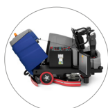
Agile accesso a tutte le componenti