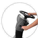
Piantone sterzo regolabile