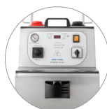
Panel de mandos con pantalla y manómetro