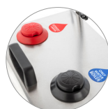
Depósitos agua y solución de limpieza