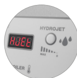
Función Hydrojet (H)