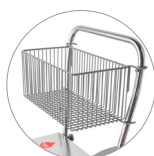
Carriles con porta-accesorios