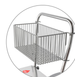
Carrello con cestino porta oggetti