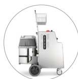
Robusta struttura in acciaio inox