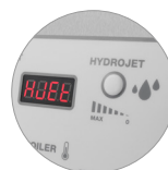
Funzione Hydrojet (H)