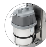
Motore aspirazione di grande potenza (V)