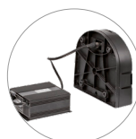
Ladegeräte und akkus