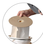
Vliesfilterbeutel und Textilfilter