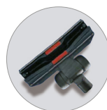
Boquilla para suelos polvo con ruedas RD 285