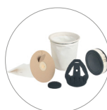
Grupo de filtros