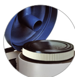
Filtro a cartuccia (HEPA optional)