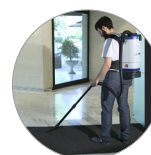
Leggero e maneggevole