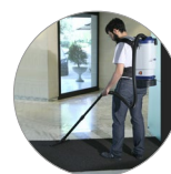
Leicht und Handlich