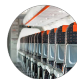
Ideal für die Flugzeugreinigung