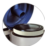
HEPA Kartuschenfilter (opt)