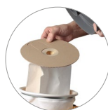
Vliesfilterbeutel und Textilfilter