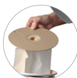
Vliesfilterbeutel und Textilfilter