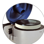
HEPA Kartuschenfilter (opt)