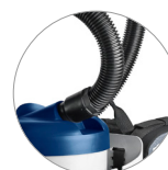
Leicht und Handlich