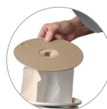
Vliesfilterbeutel und Textilfilter