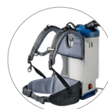
Zubehörhalterungen am Rahmengestell