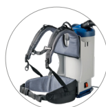
Arnés anatómica porta-accesorios cómoda