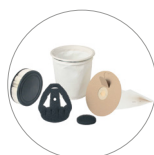
Grupo de filtros