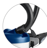
Attacco tubo flessibile