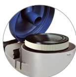
Filtro a cartuccia (HEPA optional)